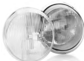
Scheinwerfer und Streuscheibe